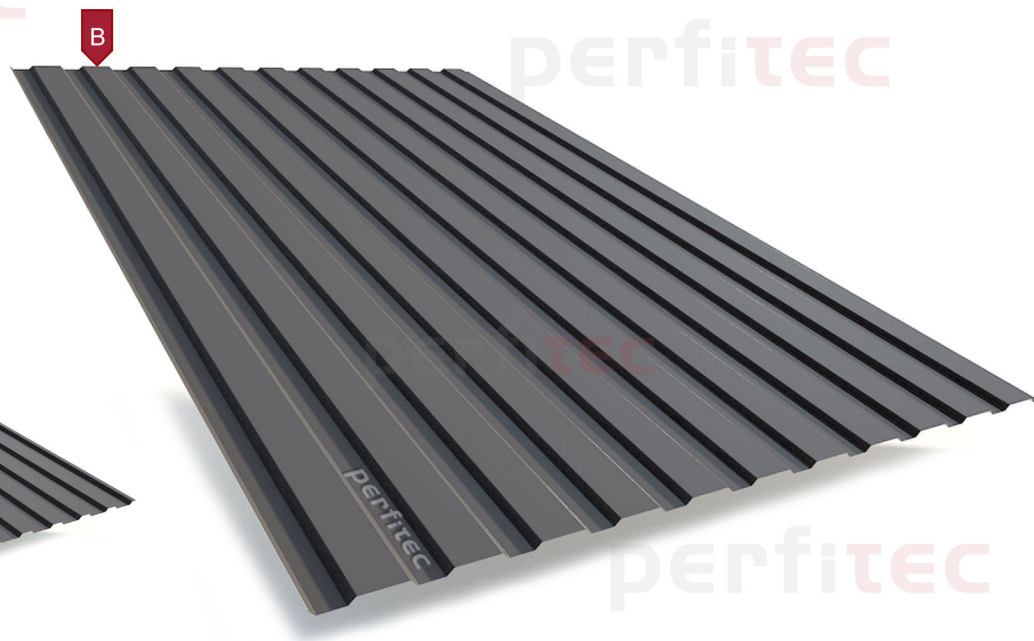
* Ref. Perfitec TR8 B/1100